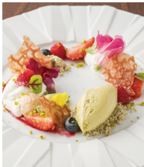
<12月限定>パティシエ特製クリスマスデザート 800円

ペットボトル飲料でも開発協力している上林春松本店がプロデュースするカフェ、Salon de KANBAYASHI（サロン・ド・カンバヤシ、所在地：京都府京都市東山区下河原通高台寺塔之前上る金園町400番1 アカガネリゾート京都東山1925内）では、2016年12月限定クリスマスデザートをご用意しました。クリスマスリースをイメージし、彩り華やかに仕上げたパティシエ特製クリスマスデザートと上林春松本店が選定した玉露と煎茶のマリアージュを、お客様に急須で淹れていただく日本茶と共にこの機会に是非お楽しみください。