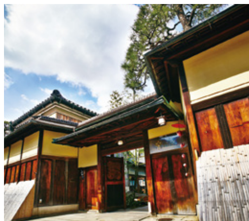
アカガネリゾート京都東山1925の玄関口

Salon de KANBAYASHIはそんな想いを持って、日本茶を提案するカフェです。創業450年の京都宇治の老舗茶舗・上林春松本店が選定した玉露と煎茶を、お客様に急須で淹れていただきお楽しみいただけます。お茶と一緒にお届けするデザートは、日本茶に合うパティシエ特製のオリジナルスイーツです。