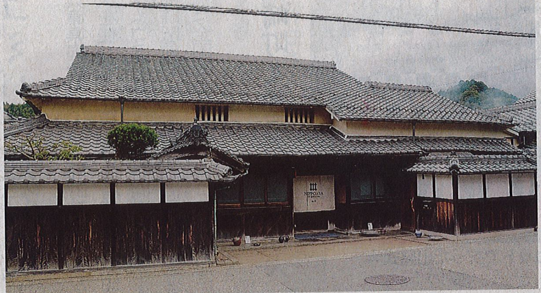
江戸時代後期の邸宅を改修した「福住宿場町ホテル NIPPONIA」が3日に開業する。

国の重要伝統的建造物群保存地区(重伝建地区)に指定されている篠山市福住地区の古民家を改修した宿場町「福住宿場町ホテル NIPPONIA」が3日に開業する。