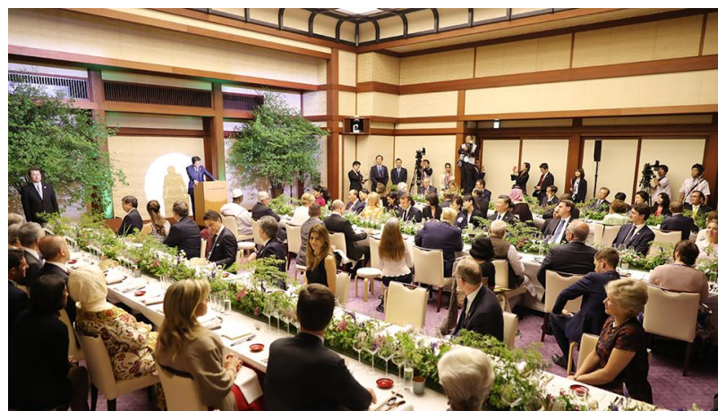
（外務省特設サイトより）

【問い合わせ先】 0120-075-390（平日：9:00-18:00） ※料金はお問合せください。