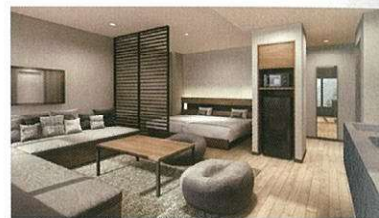
シックなデザイン空間のコンドミニアム棟