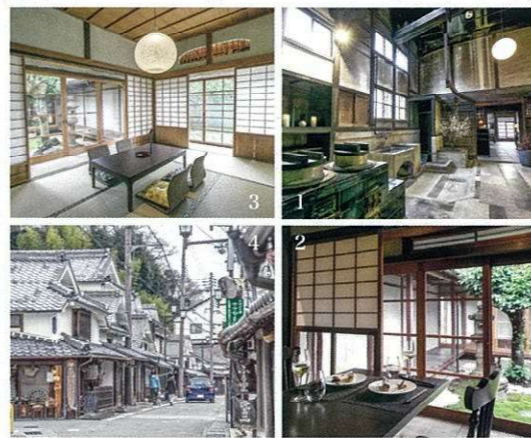
1. 酒店內仍能看到古代的廚房布置。 2. 酒店的餐廳坐擁日式庭園的景致。 3. 以茶室作主題的客房注入和式設計，能看到漂亮的日式庭園。 4. 篠山的街道充滿古代町情懷