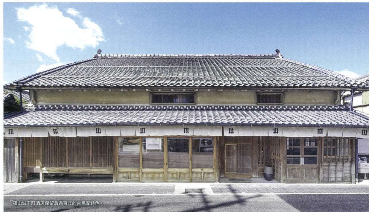
篠山城下町酒店保留着過百年的古民家特色

兵庫縣的篠山，古稱「丹波國」，400年前德川家康為了攻打豐臣家族而在此建造了篠山城，現在篠山仍保留著400年前的一磚一瓦，因此有「第一號日本遺產」的美譽。專營翻新古民家酒店的VMG旗下的篠山城下町酒店就是坐落於這個古城的中心地帶，由明治前期的百年古宅翻新改建而成，12間客房及兩棟獨立別墅散布於下町的四周，附近就是雜貨店、老舖及和菓子店。每間房的设计不盡相同，不過都能找到土牆瓦頂木橫樑及傳統的和式裝潢。