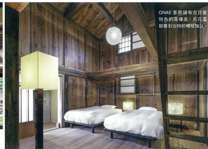
ONAE 客房擁有古民家特色的高樑底，天花還能看到古時的樑椽設計。