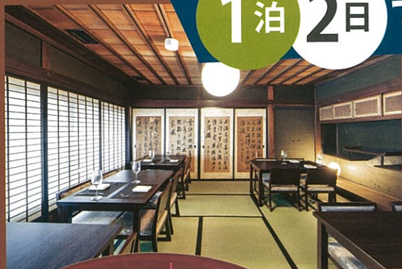
1855年建築「中村屋商店」2階がレストランに

佐原の街に残されていた古民家を宿泊施設として再生。4つの宿泊棟と1つのフロント・レストラン棟が街に点在し、街全体を一つのホテルのように楽しむことができます。13の客室は、梁や柱、元々の構造などを生かした造りになっており、それぞれに異なる趣が、人々の暮らしを長く見守ってきた建物ならではの、温かみが感じられる客室で過ごす時間は至福のときになること請け合いです。夜は地産地消のフレンチコース、朝は和朝食がいただけます。