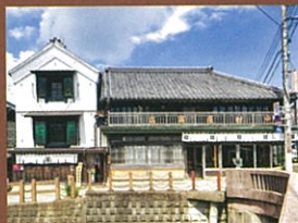
フロント・レストランのあるGEISHO棟

INFO 所 香取市佐原イ1720 (フロント・レストランGEISHO棟) 料 大人1名1泊2食付き28,000円(税別)〜/2名1室利用時・朝夕付 ☎ 0120-210-289 (VMG総合窓口11:00〜20:00) ※お電話の際は「佐原商家町ホテル NIPPONIA」のお問い合わせとお伝えください。