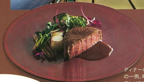
ディナーのフレンチコースの一例。時期により内容は変わります。