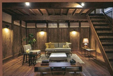
日本の伝統的な建築様式「土蔵」を改装した一室