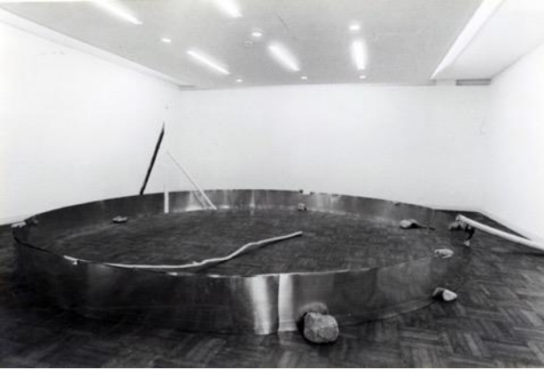
（写真上から）仙厓義梵《円相図》江戸時代・19世紀 紙本墨画 37.0×49.0cm 福岡市美術館（石村コレクション）展示期間3月11日～4月6日、菅木志雄《支空》1985年 ステンレス板、木、石、竹 510.0×570.0×153.0cm 作家蔵 撮影：菅木志雄