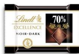
CABERNET/MERLOT × 70% CACAO