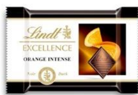
PINOT NOIR × ORANGE ALMOND