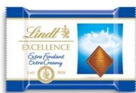
CHARDONNAY × EXTRA CREAMY