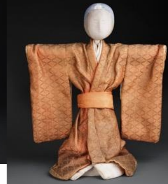
(写真左から) 古今雛、犬宮、天児 全て江戸時代