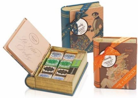
(写真右) ヴィンテージ ミニブック缶 各3,780円(税込)