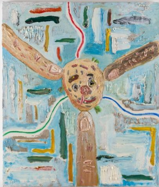
作家名：赤羽史亮 タイトル：touch 制作年：2017 サイズ：H530xW455mm 素材：キャンバス、油彩 推薦者：加藤泉