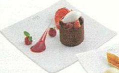
季節で異なるさまざまなスイーツメニューを提供