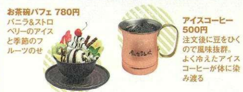
お茶碗パフェ 780円 バニラとストロベリーのアイスと季節のフルーツのせ アイスコーヒー 500円 注文後に豆をひくので風味抜群。よく冷えたアイスコーヒーが体に染み渡る

出石 ふくろう 観光エリアから少し離れた隠れ家的な喫茶店は、蔵風の外観が目印。注文後に豆を挽くコーヒーは、専門店ならではの本格派。クラシック音楽をBGMに優雅なひとときを過ごして。 ☎0796-53-1717 豊岡市出石町内町16 ☎8:00~17:00 休木曜 回あり 出石営業所バス停から徒歩3分 55 B-2