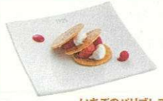
いちごのバリブレスト 900円 カリカリ食感のシューにふんわりクリームといちごが絶妙な味わい