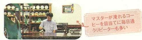
マスターが淹れるコーヒーを自当てに毎日通うリピーターも多い

オーベルジュ豊岡1925のホテルの客室は昭和初期をイメージしたおしゃれな空間です。