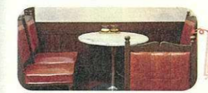
クラシカルなインテリアを配した店内奥の喫茶ルーム