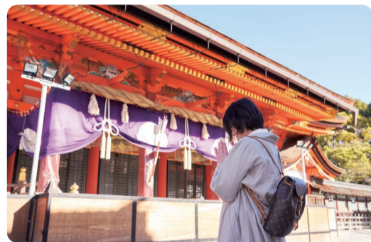
祇園造りの本殿は、昨年国宝に。そっと手を合わせて願いごとをしよう。

DATA ● 京都市東山区祇園町北側625 Tel. 075-561-6155 ◎9:00～17:00 ◎無休 京阪電車 祇園四条駅から徒歩約5分