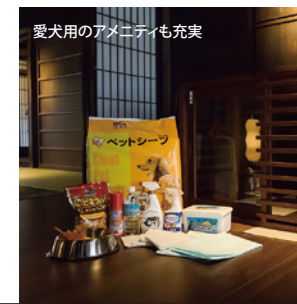
愛犬用のアメニティも充実

城下町に点在する歴史的建造物をリノベーションした計9棟21室の分散型ホテル。うち2室はペットフレンドリールームとして滑りにくいペット用の床材を使用しているほか、ワンちゃん専用の設備やアメニティも充実。開放感あふれる上質な空間でゆったりとした春の旅が愉しめます。