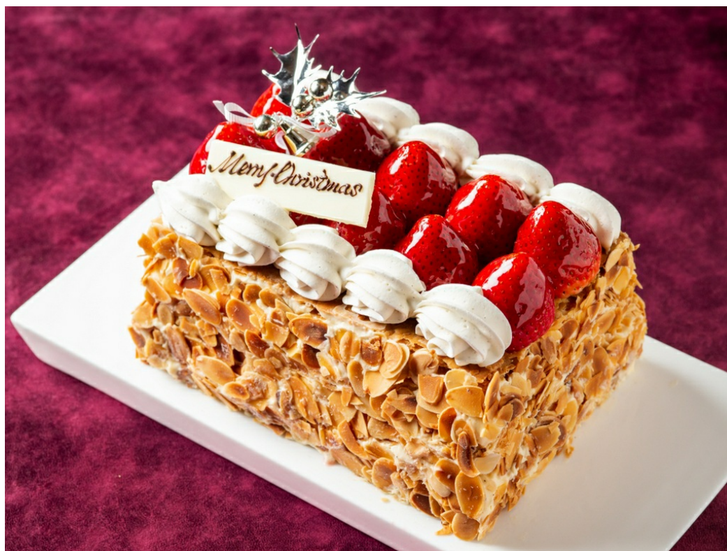
フルサイズ：約16cm×11cm×12cm 6,480円（税込）

銀座マキシム・ド・パリの味を受けつぎ、連日ご予約でお席が取れないほど人気の”苺のミルフィーユ”が、クリスマスの装いでテイクアウトメニューに登場します。一年に一度の特別な日にふさわしい贅沢なスイーツは、メディアでも多く取り上げられ話題になっています。