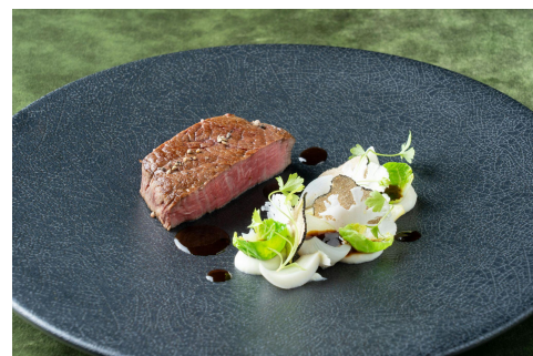
黒毛和牛フィレのポワレのイメージ