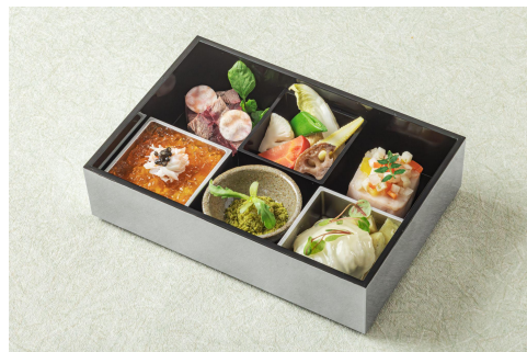
京フレンチ膳の四季を彩る洋風八寸(6種)