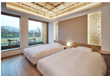
VMGデラックスの客室イメージ

多くの老舗名店が立ち並び、京の風情漂う木屋町に佇む元老舗料理旅館を受け継いだ了以棟。中でも鴨川ビューの客室は、川のせせらぎ、四季折々の表情を見せる山並みを望む心落ち着くロケーションです。旅館として歴史を刻んだかつての趣を活かしつつ折上格天井など職人の技が光るお部屋。全部屋に和室を備え、木屋町通の古き良き風情を感じながらお過ごしいただけます。