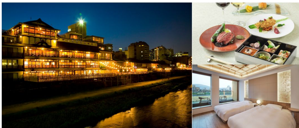
※お料理写真はイメージです