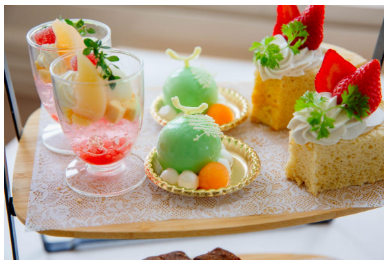
1段目は新作ミニパフェ、メロンと杏仁のムース、シフォンケーキと豪華ラインナップ(※写真は2名分です)