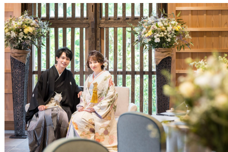
披露宴会場は元酒造の蔵を改装した 佐原商家町ホテル NIPPONIAにて執り行います