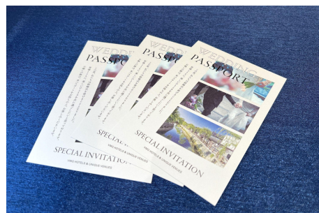
ウェディングパスポート