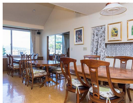
ホテル客室に改修予定の 「カフェ元町」内観写真